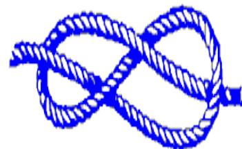
NUDO EN FORMA DE OCHO

Es un nudo sencillo y muy seguro, ya que no se deshace fácilmente. Es emplea para rematar provisionalmente la punta de una cuerda evitando que ésta se deshaga.