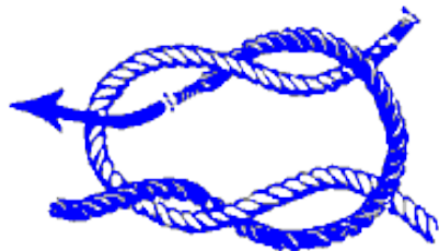
NUDO DE RIZO

Se le llama así porque se utiliza para atar los "rizos" de las velas. Estos "rizos" son cabos de cuerdas cosidos en filas horizontales a ambos lados de la vela que se atan cuando el viento es fuerte para evitar que la vela se "vuele". Este nudo se utiliza principalmente para atar dos cuerdas, siempre que éstas estén sujetas a una tensión constante, ya que si esta tensión disminuye el nudo puede aflojarse. Sin embargo, este nudo es generalmente utilizado para muchos fines; para atar un vendaje ya que es un nudo cómodo por ser plano, para atar las agujetas de los zapatos, etc.