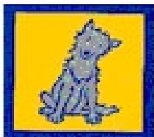
Lobo Pata Tierna

A continuación queremos presentarte unas nuevas palabras que te acompañaran en las aventuras que vivirás junto con tu manada. Presta mucha atención, ya que después encontrarás algo muy interesante que guiará tus pasos en los recorridos por Seeonee.