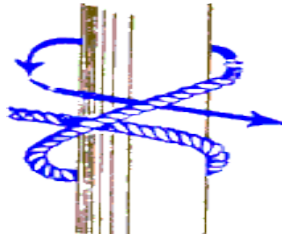
NUDO DE BALLESTRINQUE

Al igual que la vuelta de braza, sirve para sujetar una cuerda a un poste o mástil. Generalmente esto se hace cuando la cuerda se somete a una tensión constante, ya que si dicha tensión disminuye el nudo se puede aflojar. Este nudo es ideal también para comenzar y terminar un amarre.